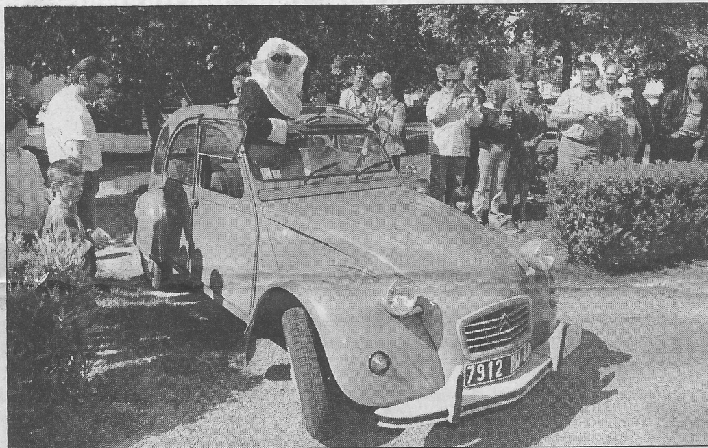
Les bonnes sœurs thermales ont enflammé les nostalgiques de la « deudeuche ».